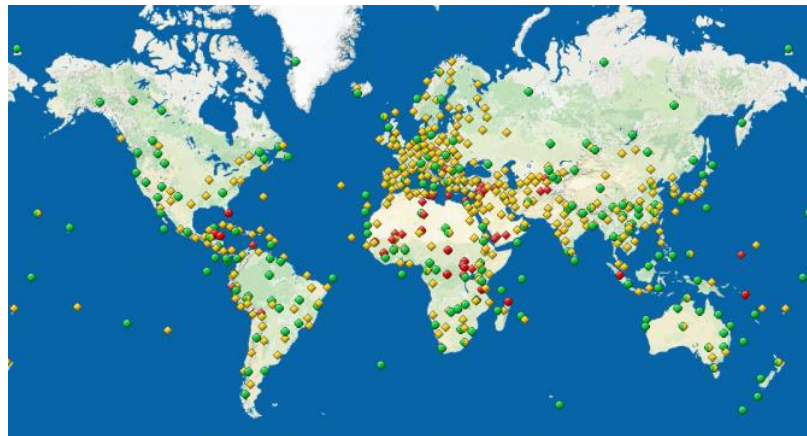
Patrimoines mondiaux de l'UNESCO

Le domaine de la culture est un secteur tout aussi important. En effet, plus de 1 200 sites sont protégés, dont des sites naturels. Nous pouvons d'ailleurs remarquer que ce secteur tend à être protégé et développé tant à l'extérieur de l'UNESCO, mais aussi à l'intérieur-même grâce à son jardin japonais, ou bien le travail des pierres fait lors de la construction.