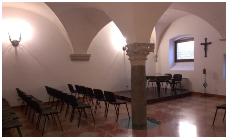
SALA DELLA COLONNA